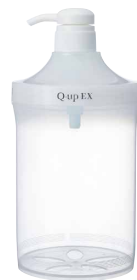
詰替専用容器(大) (シャンプー用共通) 本体価格1,000円 商品番号488