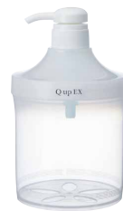
詰替専用容器(小) (ヘアパック・コンディショナー用) 本体価格900円 商品番号489