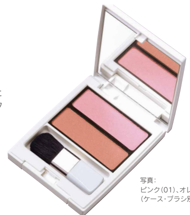
写真： ピンク(01)、オレンジ(02) (ケース・ブラシ別売り)