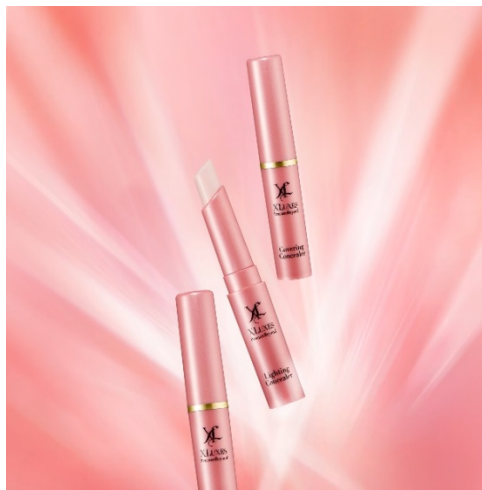
「エクスリュークス ライティングコンシーラー （ライトピンク）」

ヒト幹細胞培養液 ※2 をはじめ、先進の美容成分配合で乾燥・くすみ ※3 等のトラブルをケアし、ライティングを浴びているような、優れたメイクアップ効果を発揮しながらエイジングケア ※4 を実現します。