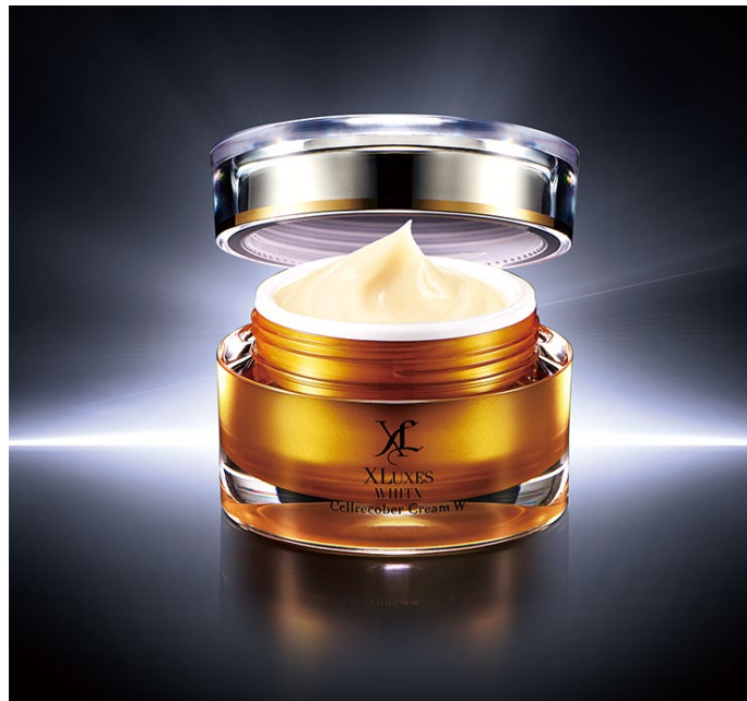
「エックスリュークス セルリカバークリームW （ダブリュー）」

化粧品・健康商品の開発・製造・販売を行う株式会社 エックスワン（本社：東京都港区 代表取締役社長：齊藤 勝久）は、先進の技術を応用したヒト幹細胞培養液 ※1 配合の美容クリーム、XLUXES（エックスリュークス）セルリカバークリームをさらに進化させた、「XLUXES（エックスリュークス）セルリカバークリームW（ダブリュー）」（1品目1品種、税抜28,570円）を11月1日より直営店舗及び当社直販サイトや他ECサイト等で販売します。