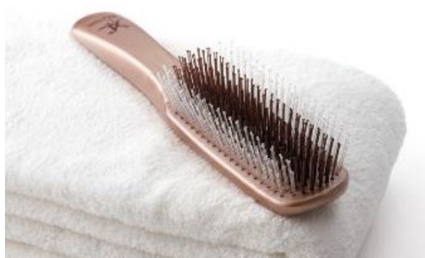
「エックスリ्यूクス エグゼティシャン スカルプブラシ」