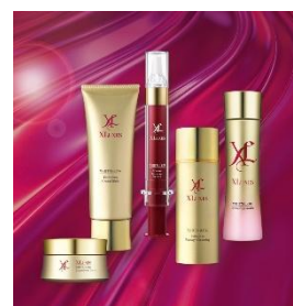
ヒト幹細胞培養液配合コスメ 「XLUXES (エックスリュクス)」